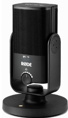
Vorne ist der Lautstärkereger für den Kopfhörerausgang, der RØDE-Schriftzug verweist auf die korrekte Einsprechrichtung