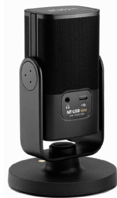
Auf der Rückseite des NT-USB MINI befinden sich die 3,5-mm-Kopfhörerbuchse und der USB-C-Anschluss