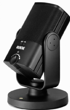
Die Gabelhalterung erlaubt ein bequemes Positionieren des Mikrofons und kann zur Tischnutzung einfach aufgesteckt werden: der robuste Stahlsockel ist nämlich magnetisch